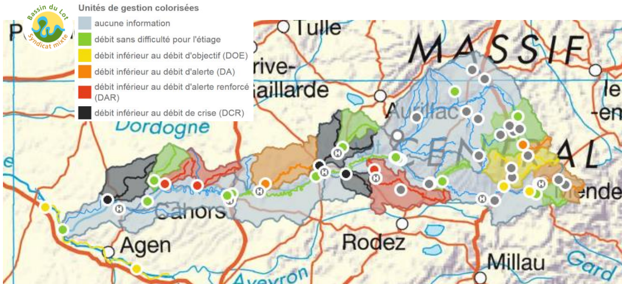
Cartographie du franchissement des débits seuils du bassin du Lot au 02/10/2019

Le 2 octobre, 11 stations ont franchi le DOE, 9 le DA, 6 le DAR et 3 le DCR.