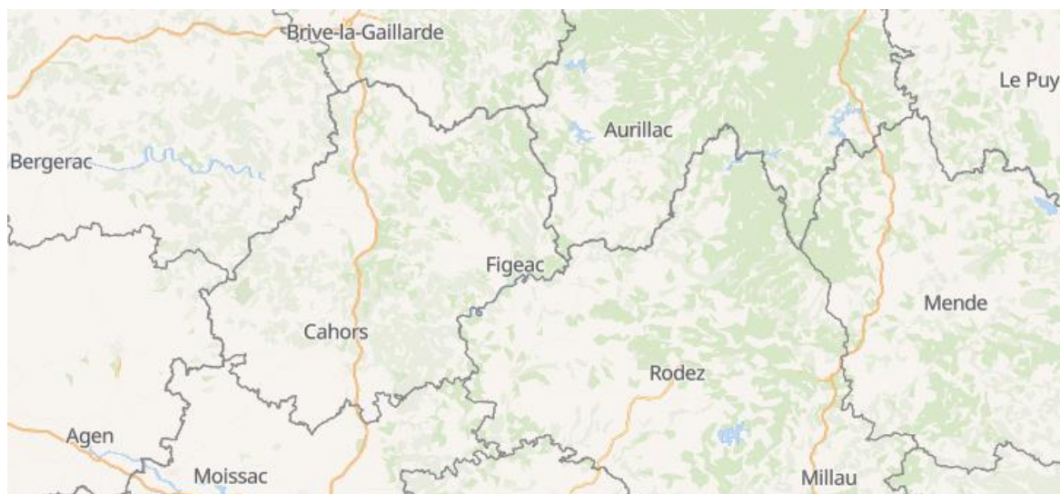
Carte des arrêtés de restriction des prélèvements d'eau publiés au 18 juillet 2024

Lien du site internet Propluvia : https://propluvia.developpement-durable.gouv.fr/propluviapublic/voir-carte