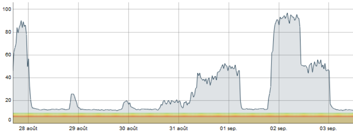
Graphique des débits instantanés enregistrés à Cahors du 28 août au 3 septembre 2020

http://laviedelariviere.valleedulot.com/