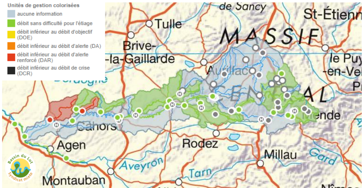
Cartographie du franchissement des débits seuils du bassin du Lot : au 10/07/2019

Le 10 juillet, 2 stations ont franchi le DAR.